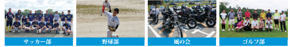
サッカー部 野球部 風の会 ゴルフ部